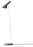
AJ Lámpara de pie