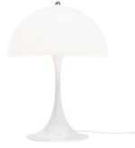
Panthella 400 Lámpara de sobremesa